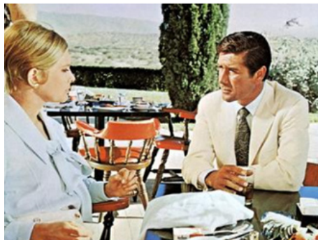
1969 QU'EST-IL ARRIVÉ À TANTE ALICE ? (What ever happened...) de Lee H. Katzin avec R. Fuller