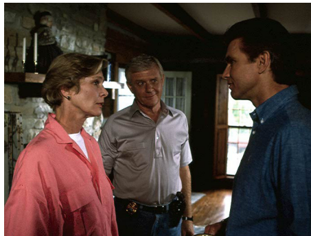
1989 NASHVILLE BEAT (Nashville Beat) de Bernard L. Kowalski avec Martin Milner, Kent McCord