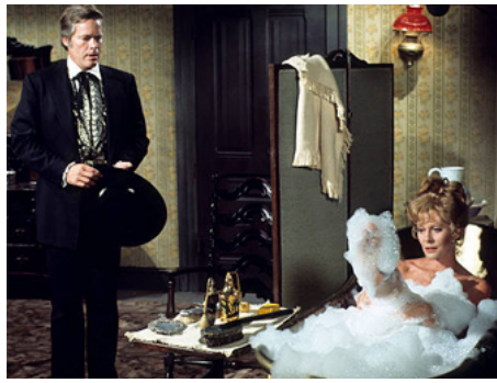
1975 LA CÔTE SAUVAGE (Jesse Who ?) de Bill Bixby avec Doug McClure