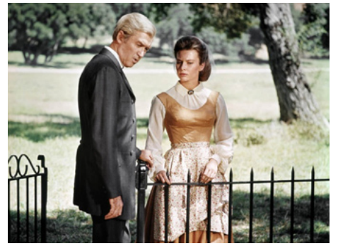
1964 LES PRAIRIES DE L'HONNEUR (Shenandoah) d'Andrew McLaglen avec James Stewart