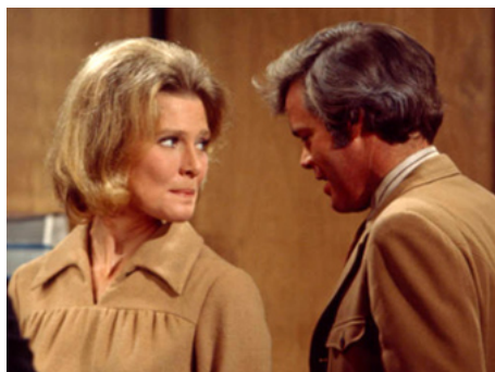
1971 THE DEATH OF ME YET de John Llewellyn Moxey avec Doug McClure