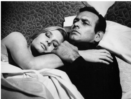
1969 WHERE IT'S AT de Garson Kanin avec David Janssen