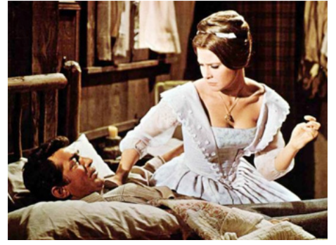
1966 TEXAS NOUS VOILÀ (Texas across the River) de Michael Gordon avec Dean Martin