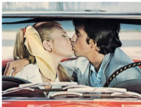
1970 HOW DO I LOVE THEE ? de Michael Gordon avec Rick Lenz