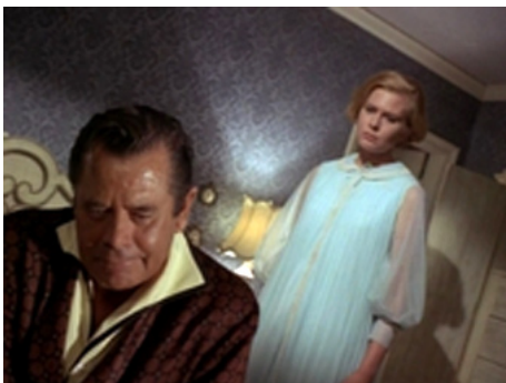
1970 LA FRATERNITÉ OU LA MORT (The Brotherhood of the Bell) de P. Wendkos avec Glenn Ford