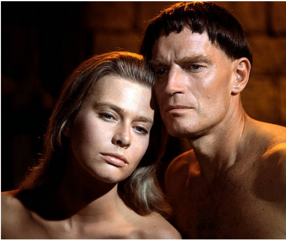
1965 LE SEIGNEUR DE LA GUERRE (The War Lord) de Franklin J. Schaffner avec Charlton Heston