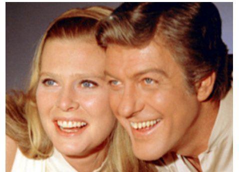
1969 SOME KIND OF A NUT de Garson Kanin avec Dick Van Dyke