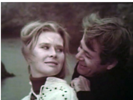
1971 Y A-T-IL UN DOCTEUR DANS LA MAISON ? d'E. W. Swackhamer avec William Windom