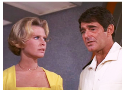
1971 LA CITADELLE SOUS LA MER (City beneath the Sea) d'Irwin Allen avec Stuart Whitman