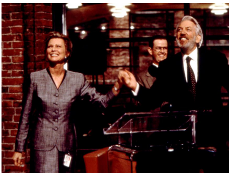
1994 HARCÈLEMENT (Disclosure) de Barry Levinson avec Dylan Baker, Donald Sutherland