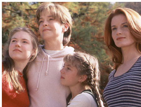
1995 L'AUTRE FEMME (The Other Woman) de Gabrielle Beaumont avec Laura Leighton, Jill Eikenberry