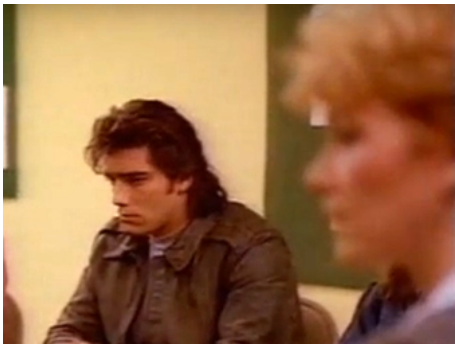
1986 LE JUSTICIER DE LA ROUTE (The Gladiator) d'Abel Ferrara avec Ken Wahl