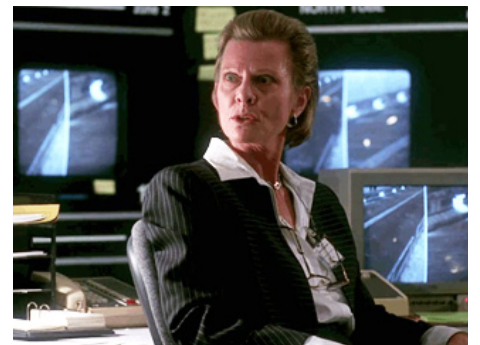
1996 DAYLIGHT (Daylight) de Rob Cohen