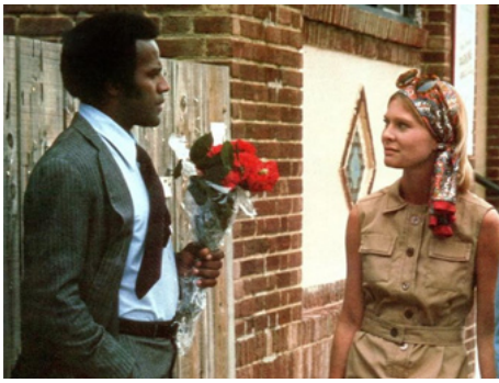
1974 BLACK-EYE (Black-Eye) de Jack Arnold avec Fred Williamson