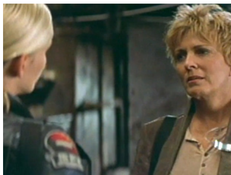
2001 GHOSTS OF MARS (Ghosts of Mars) de Jack Carpenter avec Natasha Henstridge