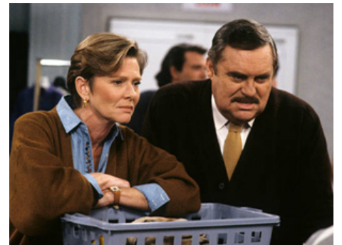
1990 LE MARIAGE DE M. BELVÉDÈRE (Mr Belvedere's Wedding) de Don Corvan avec Christopher Hewett